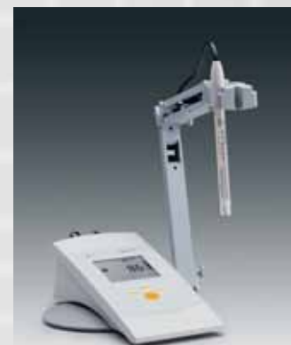
Notre pH-mètre de laboratoire, le PB-11

Si le pH est > 7 , c'est-à-dire dans un environnement alcalin, les bactéries se sentent comme chez elles; en revanche, il en est autrement si le pH est < 7 , c'est-à-dire dans un milieu acide.