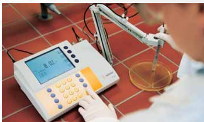
Un pH-mètre en action