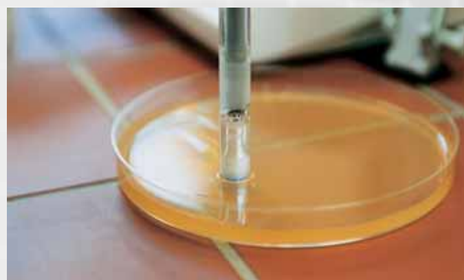
L'électrode de surface